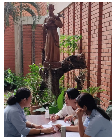
Une réunion en présentiel vaut mieux que zoom.

"La formation a introduit le concept d'avoir un plan d'activités pour la sauvegarde dans les unités. Cela rendra les formations sur la sauvegarde et d'autres programmes connexes plus structurés et rationalisés au lieu de le faire au hasard."