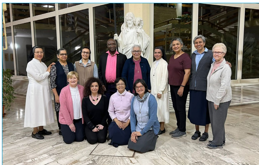
Équipe de sauvegarde avec certains des anciens membres du CLT

ROME: Lors de la réunion de l'équipe en février, nous avons travaillé sur le plan stratégique de sauvegarde et sur la meilleure façon d'atteindre et de soutenir les unités. Un programme résidentiel de 5 jours Formation des formateurs en sauvegarde a été proposé par l'équipe et nous l'avons facilité dans diverses régions du monde. Les participants étaient les personnes désignées de sauvegarde au niveau de l'unité, les chefs d'unité et les conseillers de liaison d'unité pour la sauvegarde.